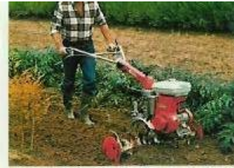
Outil rotatif standard 111 65 013