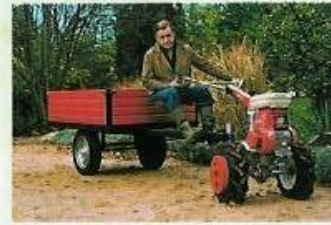
Remorque 700 kg