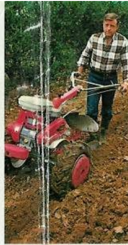
Brabant 1/2 tour et roues 6.0 x 12

Le F 700 reçoit tous les outils nécessaires à tous les travaux de la terre et notamment : outils rotatifs à 4, 6 et 8 étoiles - roues profil agricole 4.0 x 7, 4.0 x 10, 5.0 x 10, 5.0 x 12, 6.0 x 12 - charrue simple, charrue déportable, brabant 1/2 tour et 1/4 tour - charrue tourne-oreille NIP - tondeuse à roues motrices, largeur de coupe 0,60 m avec possibilité d'ouverture avant pour grandes herbes - faucheuse frontale oscillante type intermédiaire ou passe-partout, largeur de coupe 0,90 m, 1,10 m, 1,20 m - tondo-broyeuse - cultivateurs - butteur - bineuse - herse - souleveuse de pommes de terre - remorque - pompe, etc. De nombreux outils de fabrication locale sont proposés en outre chez chaque concessionnaire.