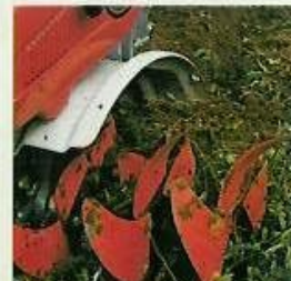
outil broyeur-entousséur 013