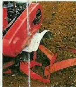
Roto - sarcléur 130 50 013