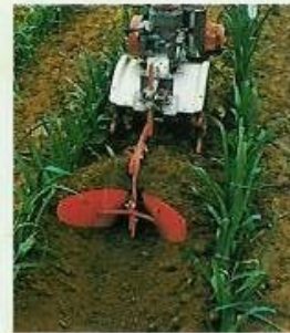
Butteur 144 40 013 et roues fer voie étroite