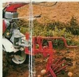
souleveuse de pommes de terre